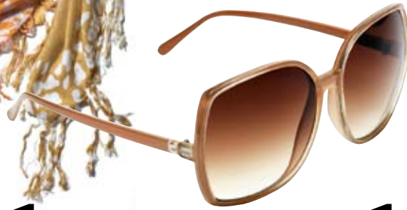
Halstuch von New Yorker Sonnenbrille von H&M Kleid von Vero Moda