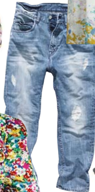
Jeans von H&M Ankle Boots von Görtz 17